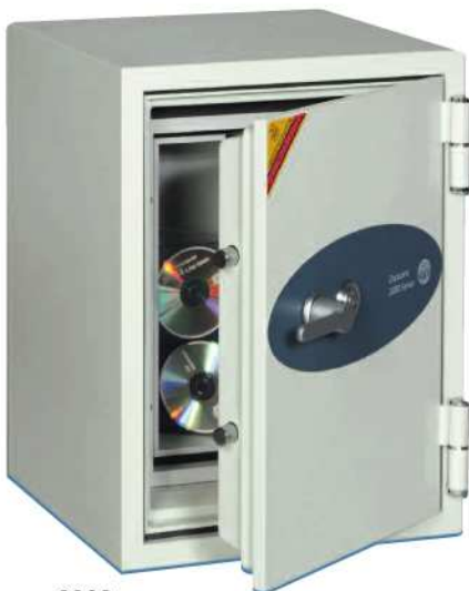
Datacare 2002 A 685mm x 470mm x 470mm B 380mm x 235mm x 187mm C 541mm/30mm D 95 kgs E 600 x 3,5" disquette 370 x 5,25" disque souple 46 x cartouche de données 3M 6150