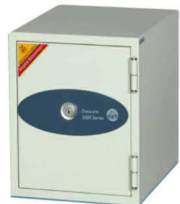
Datacare 2001 (ignifuge 90mn) A 412mm x 350mm x 432mm B 45mm x 155mm x 197mm C 305mm 2 D 43 kgs E 274 x 3,5" disquette 192 x 5,25" disque souple 22 x cartouche de données 3M 6150