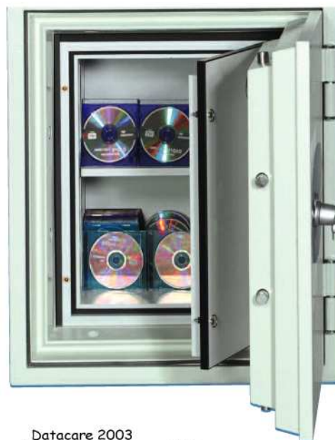
Datacare 2003 A 855mm x 690mm x 720mm B 495mm x 400mm x 405mm C 609mm/30mm D 242 kgs E 2980 x 3,5" disquette 3003 x 5,25" disque souple 250 x cartouche de données 3M 6150