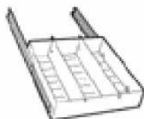
Tablette aménageable coulissante